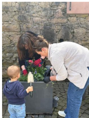
28.04.2025: Frühlingserwachen auf dem Schlossplatz