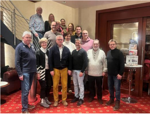
18.01.2025: Klausurtagung der CDU Babenhausen im Hotel Residenz Babenhausen