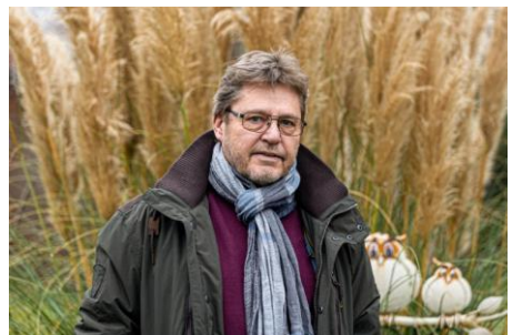
Fraktionsvorsitzender Rolf Gründling