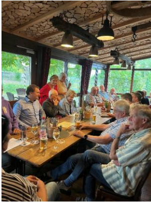
28.08.2025: „Babbelrunde“ in der Langfeldsmühle in Hergershausen