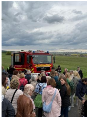
21.04.2025: Traditioneller Osterspaziergang der CDU in Hegerhausen