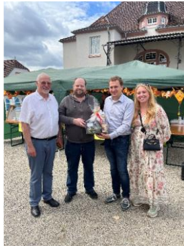
21.09.2025: Familienfest in den Kaisergärten